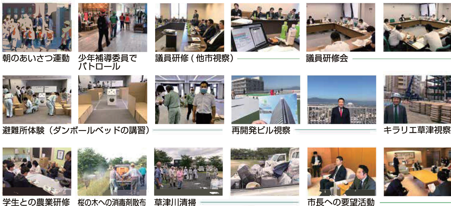
朝のあいさつ運動